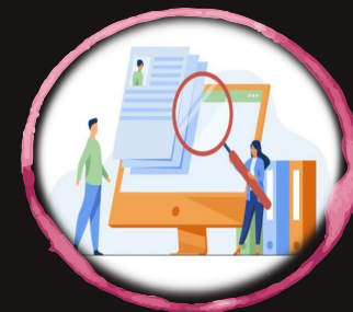
Bolsa de trabajo