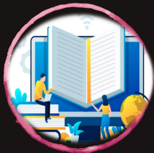
Academia Pop Up